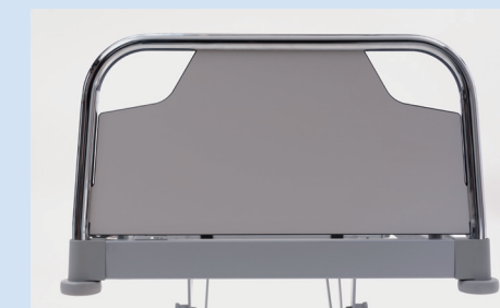
④ Absturzsicherung am Fußende