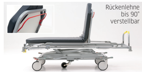
Rückenlehne bis 90° verstellbar

Der ST20S Stretcher wurde entwickelt, um in den verschiedensten Situationen schnell und effizient Erste Hilfe leisten zu können. Zahlreiche Möglichkeiten und Zubehörteile erleichtern die Arbeit des Pflegepersonals erheblich und der Komfort des Patienten nimmt zu.