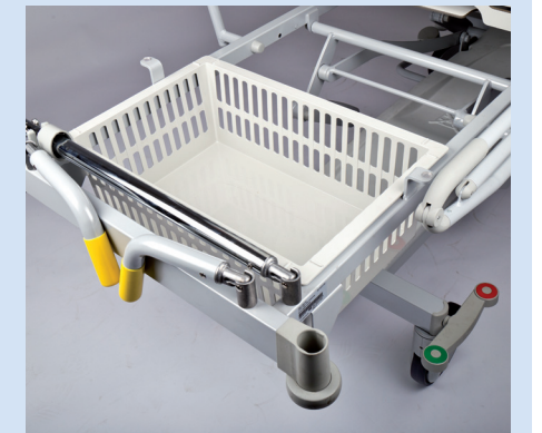
⑦ Ablagekorb für Utensilien